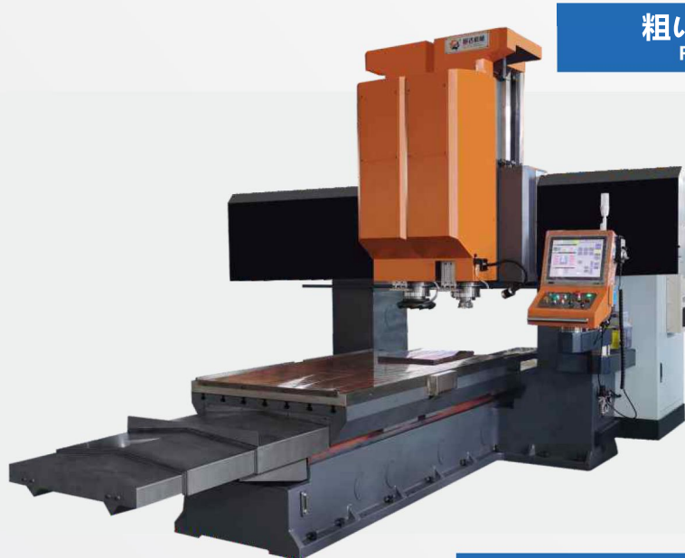
粗い切削カッター Rough cutter